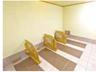
床にタイルを貼って陶板浴の完成です