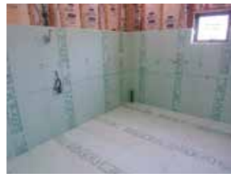
床・壁・天井に断熱材を入れます（壁は二重）