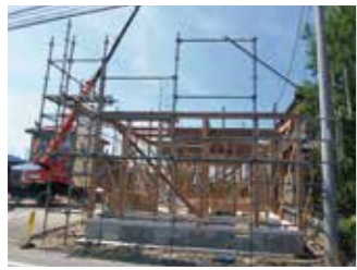
住宅同様に柱・梁等を組んでいきます