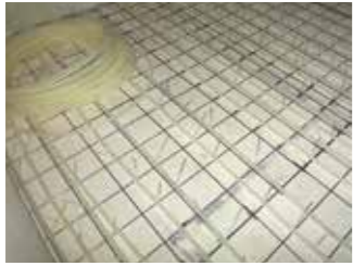
床は合板を貼り、ワイヤーマッシュを敷いて 温水用パイプを固定後にモルタルを流します ※画像は温水式ポイラー熱源の場合です。 施工が簡単な電気式もあります。