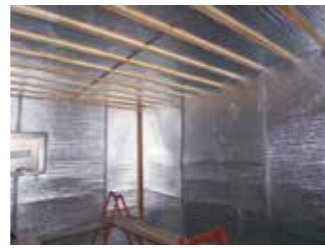
床・壁・天井に遮熱シートを貼ります