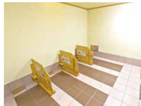
抗酸化陶板浴の浴室内

そのため体への負担も少なく、湿度が高い空間や息苦しさ苦手な方にもご利用いただけます。