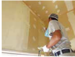
壁・天井は石膏ボードを貼り、仕上げとして リバーコート（珪藻土仕上げ材）を塗ります