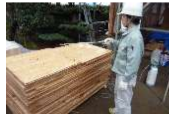
合板は、初めに重ねた状態で側面に噴霧した後、1枚ずつ両面に噴霧します。