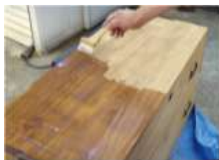
木目に沿って塗布します