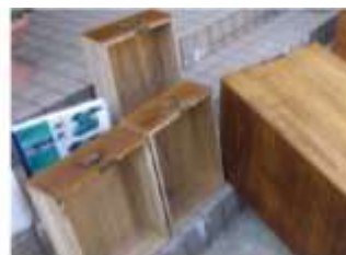
引き出しは内部にも塗布します