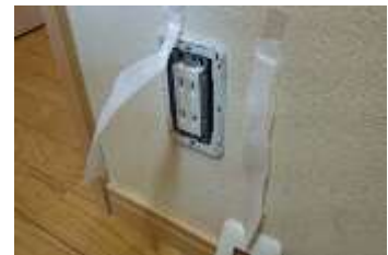
コンセント周りのティッシュが風でなびいています。