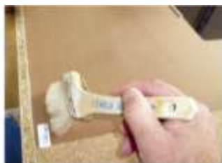
背面への塗布も重要です