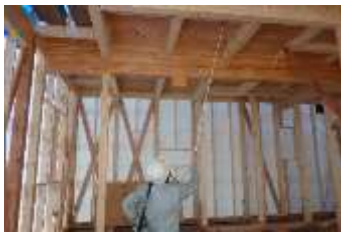
ノズル部分が伸縮できる噴霧器を使うと効率よく作業できます。