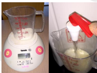
リフレパウダー ※事前に溶かしておく (冬などはお湯を使うと早 く溶けます)