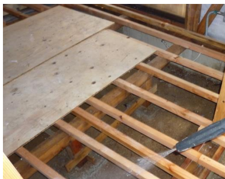
床や基礎部分にもリバーズシ ーラー混合液を噴霧する