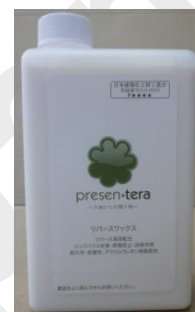
リバースワックス 1L