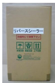
リバーズ シーラー