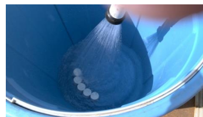
セラミック水 水道水に「工事用セラミック ス」を入れ、3 時間おくとセラ ミック水ができます