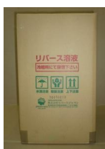
工事用 リバーズ溶液