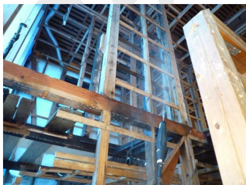
柱等にリバーズシーラー混合 液を 8 回程度噴霧する