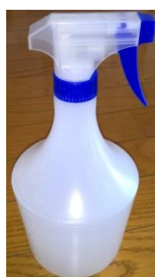
スプレー容器 ※500cc 程の容量